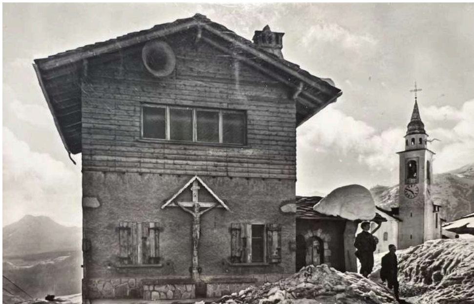
La stazione della funivia nel 1962