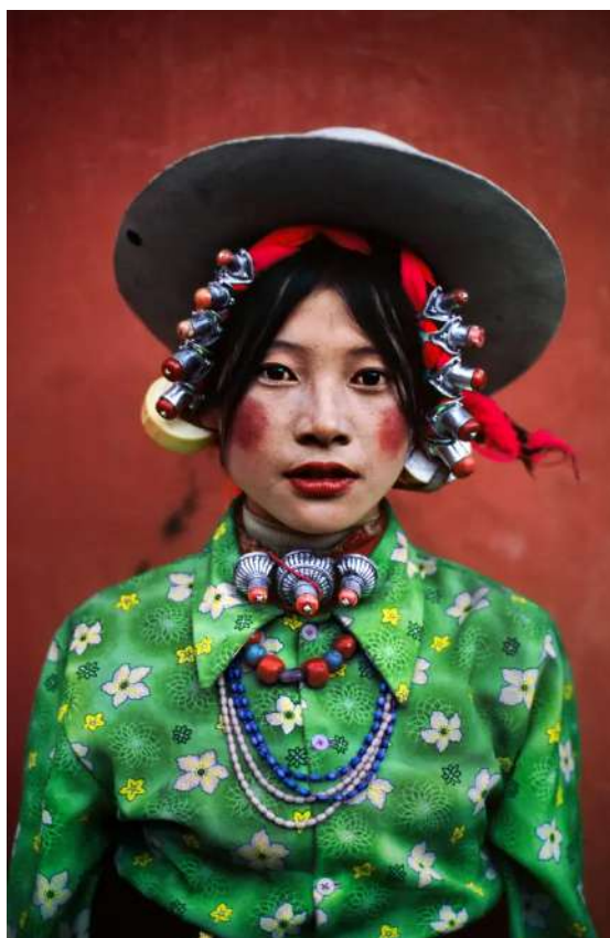
Tagong, Tibet, 1999