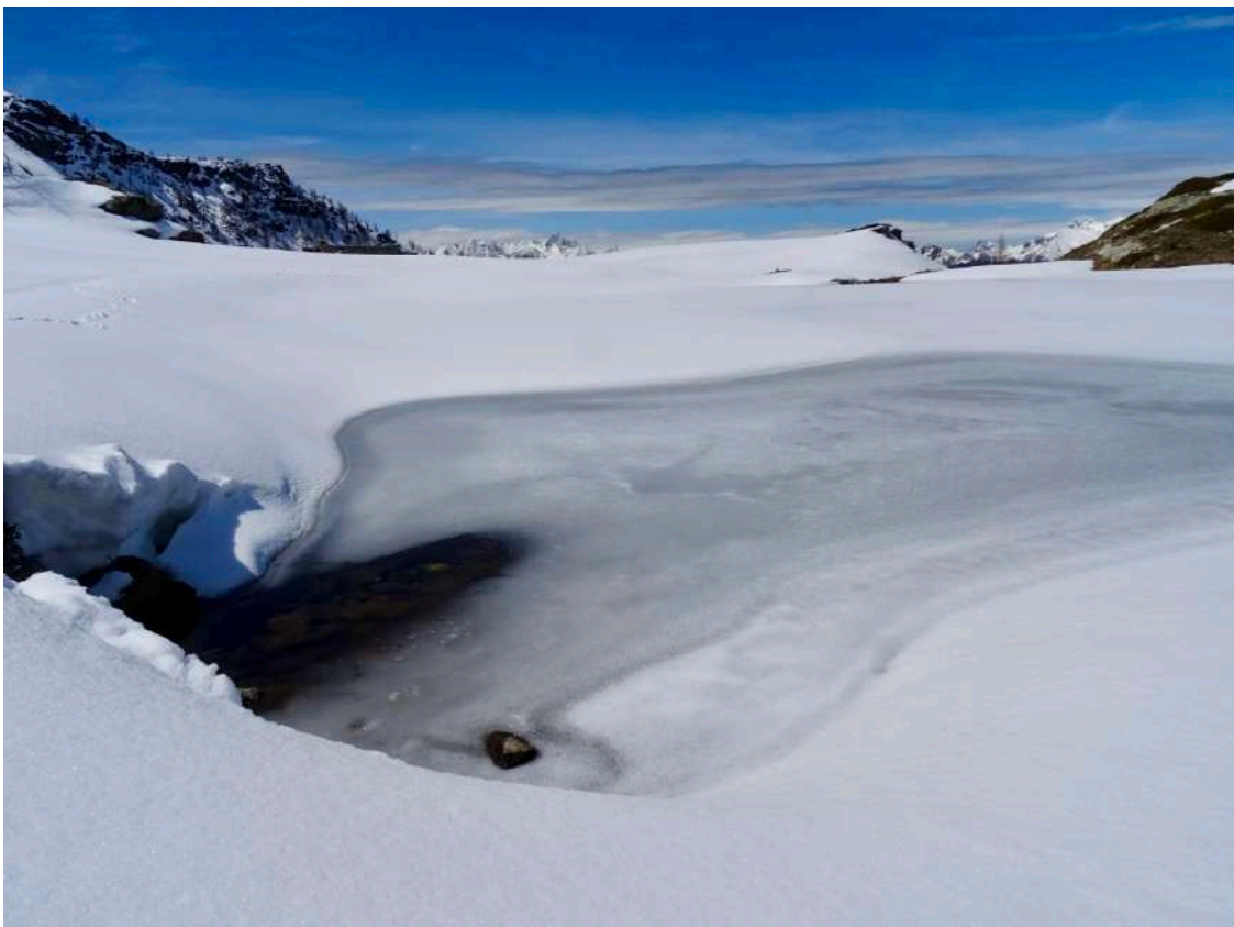
Lago di Champlong, 8 maggio 2021

Maggio: un mese di transizione per Chamois. Si prepara la stagione estiva, i lavori agricoli si svolgono a pieno regime e quelli edili riprendono. Mentre cominciano a fiorire i prati (e a valle è già piena primavera) a Chamois potrebbe ancora arrivare una nevicata tardiva! Maggio è anche il mese della Festa del lavoro (1 maggio), della Festa della mamma (11 maggio), e dei fiori, la cui regina indiscussa è la rosa: se ne parla nello "Spirito del mese".