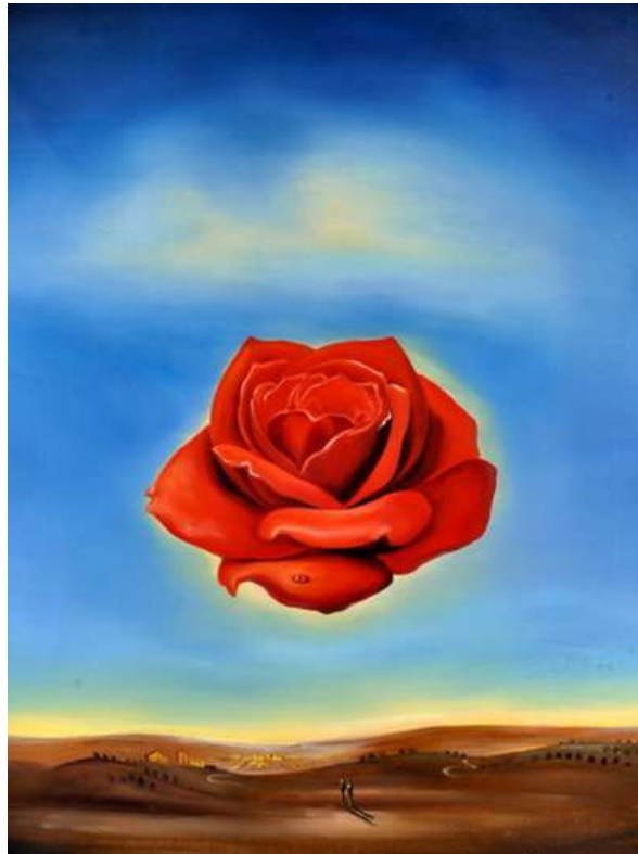
Dalí, Rosa meditativa , 1958

A maggio, mentre la rosa diventa protagonista del nostro paesaggio, impariamo da essa che la bellezza non ha bisogno di parole per essere riconosciuta. In questo paesaggio, la rosa, fragile ma potente, rappresenta non solo la natura che ci circonda, ma anche l'essenza di ciò che è eterno, pur nella sua apparente semplicità.