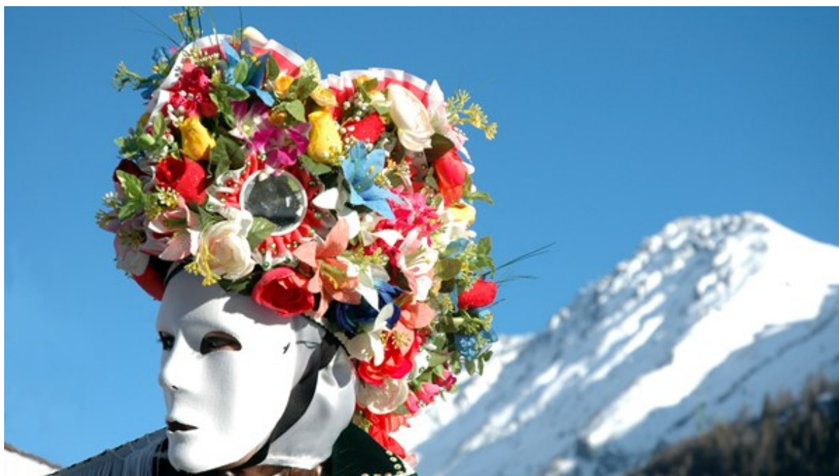
Carnevale della “Coumba freida”

Benvenuto nel mese di marzo! In questo mese “pazzerello”, celebriamo il Carnevale riflettendo sulla figura del “matto” e sulla bellezza della follia. Vi presentiamo inoltre un ricco programma di eventi e cultura, con anticipazioni su notizie importanti per la comunità.