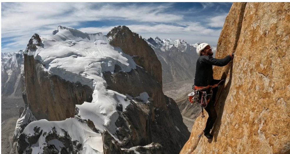
Lo scalatore catalano Edu Marín nel film Keep it burning , regia di Guillaume Broust.