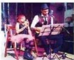
L'UluLele in concerto

Lo spettacolare ambiente montano del 1815 metri di Chamois è la cornice ideale della rassegna MusicAbilmente, che da tre anni cerca di avvicinare la gente normodotata alla disabilità e viceversa utilizzando il linguaggio universale della musica. Sotto la guida del direttore artistico Enrico De Palmas, domani e domenica, nella piazza del paese, sfileranno gruppi di Aosta, Torino, Modena e Roma che sono frutto di approcci diversi alla realizzazione di percorsi formativi e riabilitativi. Si partirà alle 15 di domani con la Taxi Orchestra, real-