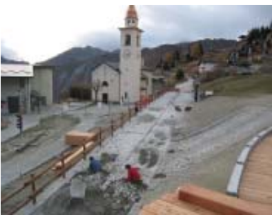
Quasi al termine