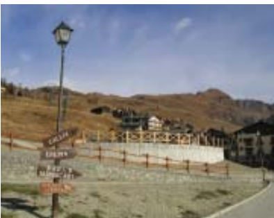
Manca solo il verde