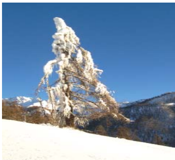
Scherzi del gelo

Supplemento a VERDE AMBIENTE registrato presso tribunale di Roma n° 106/85 Registro della Stampa del 22.02.1985 – VERDE AMBIENTE: ISSN 1122/6102 dir. Resp. Carlo Catelani reg. naz. Stampa n° 4168 vol. 42 foglio 537 del 20.04.1993. Redatto nel dicembre 2007 - Associazione "Ensembio a Tzamouè" (con sede presso la casa Comunale di Chamois) Hanno collaborato: Michele Calli, Marlo Puccl, Laura Strocchi, Piergiorgio Vay. Impaginato da Lucetta Dallaglio su progetto di Giovanna Baderna Stampa: Laser Copy - Milano