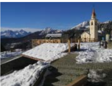
Sotto la neve molto lavoro