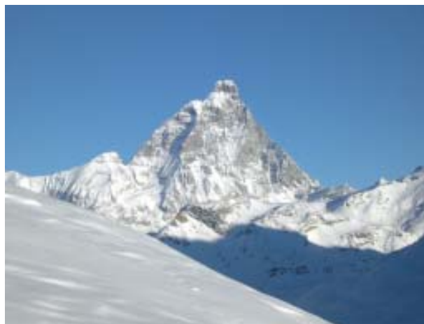
Vista della Clavalitè